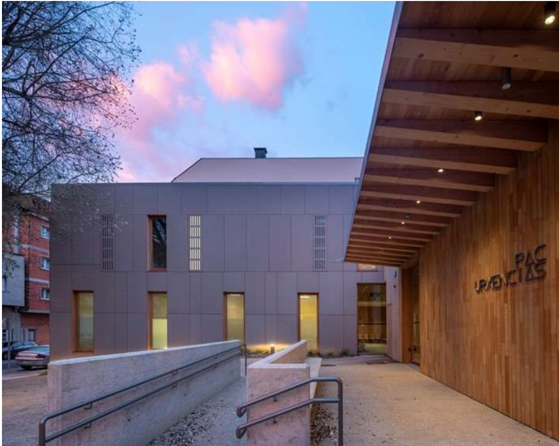
Punto de atención continuada (PAC) de A Laracha (A Coruña) - Servizo Galego de Saúde (2019) | Ezcurrea e Ouzande Arquitectura | Fotografía: Héctor Santos-Díez