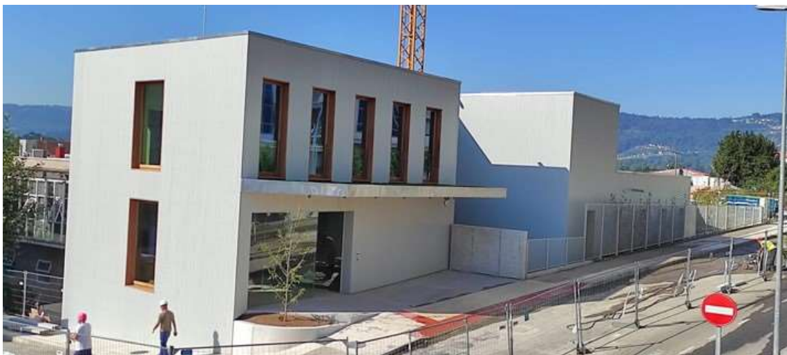
Ampliación del centro de salud de Porriño (Pontevedra) - Servizo Galego de Saúde (2023) | Ezcurrea e Ouzande Arquitectura | Fotografía: Ezcurrea e Ouzande Arquitectura