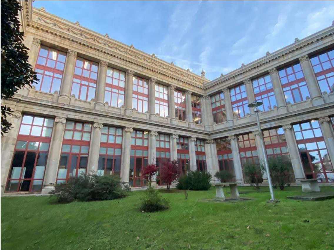
Ventanas de castaño de la Facultad de Medicina en Santiago de Compostela (A Coruña) - Universidad de Santiago de Compostela (2020)

- La clasificación de grandes escuadrías se está completando a nivel nacional en estos momentos, siendo previsible su incorporación en norma europea próximamente.