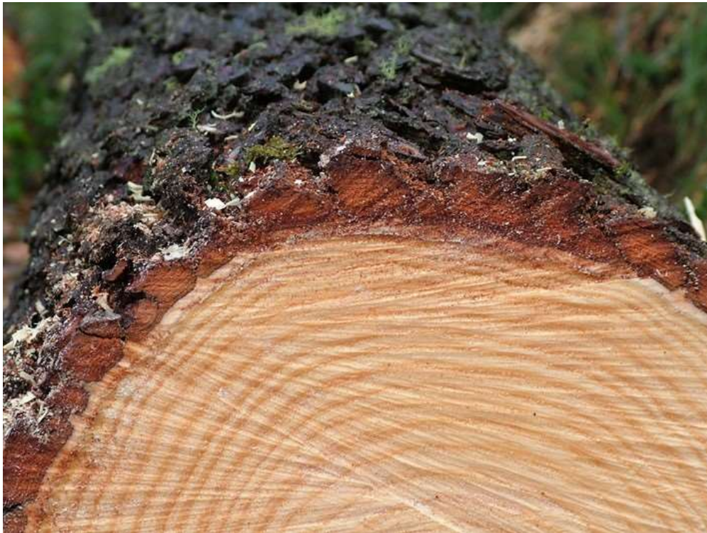
Troza de pino

Fuente: Estudio del Instituto Ruralia (Universidad de Helsinki) en el que se aplicó un modelo de simulación (RegFin3) con el fin de estimar las repercusiones económicas existentes en materia de políticas de impulso en la construcción con madera.