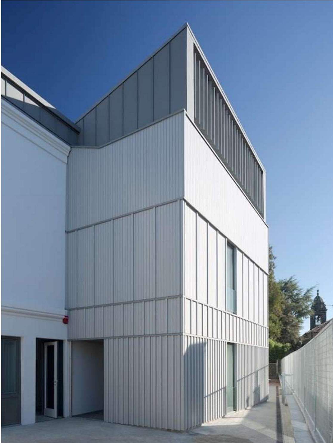
Fachada de madera de la escuela infantil Santa Susana, Santiago de Compostela (A Coruña) - Consejería de Política Social de la Xunta de Galicia (2018) | Arrokae Arquitectos