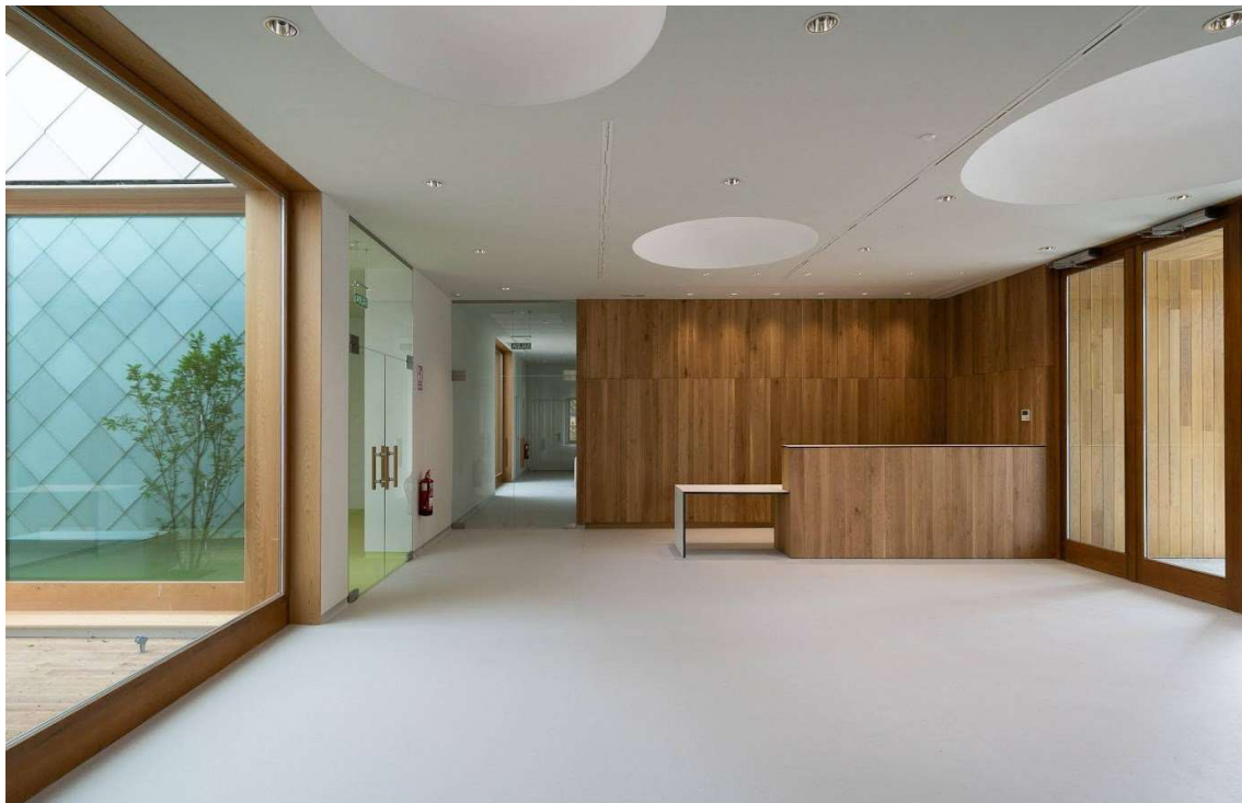
Centro de salud de O Saviñao (Lugo) - Servizo Galego de Saúde (2021) | Ezcurra e Ouzande arquitectura

Debemos tener presente ciertos conceptos erróneos del comportamiento ante el fuego de la madera que siguen siendo la causa de que su uso se vea muy penalizado por mucha de la normativa actual. Habitualmente estos conceptos están basados en experiencias de incendios con estructuras muy ligeras que poco tienen que ver con las estructuras de madera masiva utilizadas en edificios de cierta envergadura.