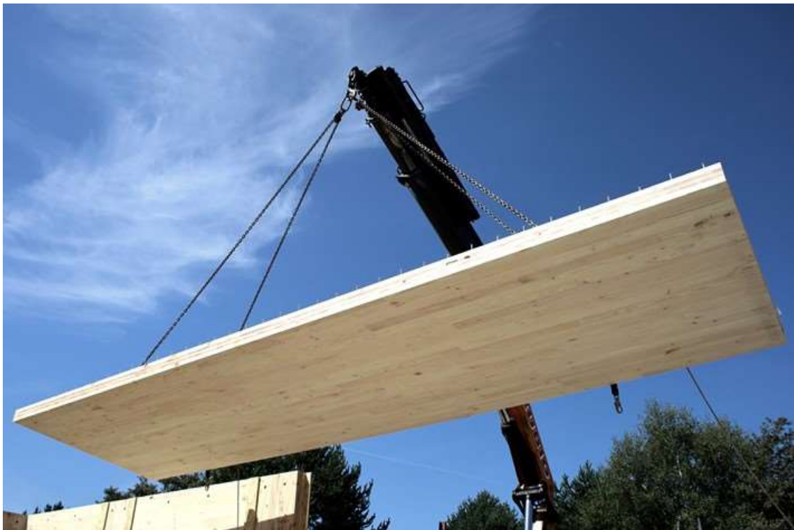
Montaje de la estructura de CLT de pino gallego de la Base de Unidad Operativa (BUO) de Muíños (Ourense) - Consejería del Medio Rural de la Xunta de Galicia (2023) | MOLA Arquitectura