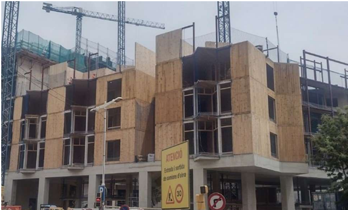
Montaje de estructura de CLT de pino gallego en la promoción Illa Glòries, Barcelona – IHAMB Instituto Municipal del Habitat y la Rehabilitación del Ayuntamiento de Barcelona (2023) | Certo estudio

Muchas veces la solución estriba en dirigirse a expertos de entidades públicas (XERA) o asociaciones de fabricantes para disponer de información suficiente en la toma de decisiones. Para más información ver anexo 1.