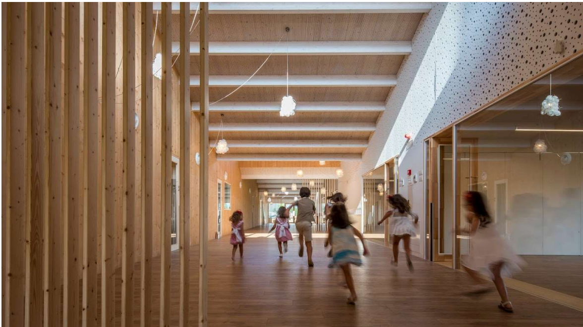
Escuela infantil A Baiuca en A Estrada (Pontevedra) - Ayuntamiento de A Estrada y Consorcio Gallego de Servicios de Igualdad y Bienestar (2018) | Ábalo y Alonso Arquitectos | Fotografía: Héctor Santos-Díez