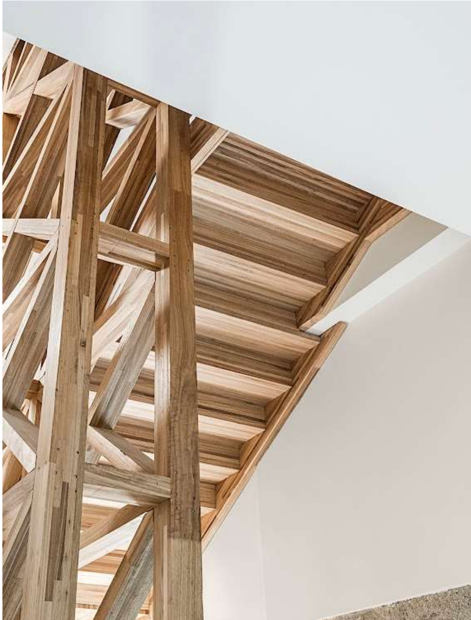
Escaleras de eucalipto laminado del ala sur del conjunto de San Domingos de Bonaval en Santiago de Compostela (A Coruña) - Consorcio de la ciudad de Santiago de Compostela (2021) | Oficina técnica del Consorcio | Fotografía: Elisa Gallego Picard

Al optar por la construcción en madera, los agentes públicos destinan recursos comunes a dos importantes objetivos: reducir las emisiones climáticas mediante el secuestro de dióxido de carbono en los edificios; y apoyar el desarrollo de la cadena de valor forestal-madera, que representa una fuente de beneficios ambientales, sociales y económicos, especialmente relevante en comarcas rurales afectadas por las dinámicas de despoblamiento, con baja actividad de gestión forestal y donde es elevada la recurrencia de la actividad incendiaria.