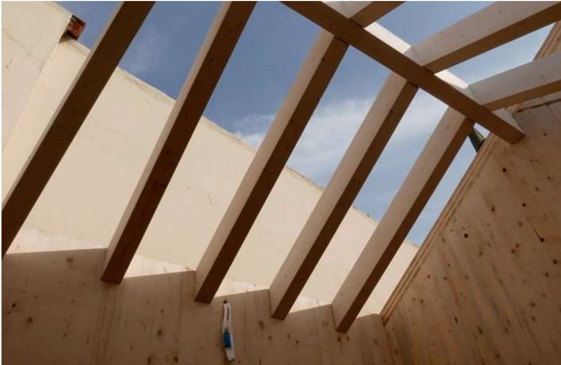
Estructura de cubierta de Redeiras, edificio institucional de la Universidad de Vigo en Vigo (Pontevedra) – Universidad de Vigo (2018) | Abalo Alonso Arquitectos

La República Checa introdujo una nueva normativa sobre contratación pública el 1 de enero de 2021, estableciendo nuevos requisitos y criterios de carácter ambiental. Como medida de apoyo a esta nueva regulación, el Ministerio de Agricultura ha publicado una "Guía sobre el uso de la madera en la contratación pública" que incluye recomendaciones análogas a la presente guía.