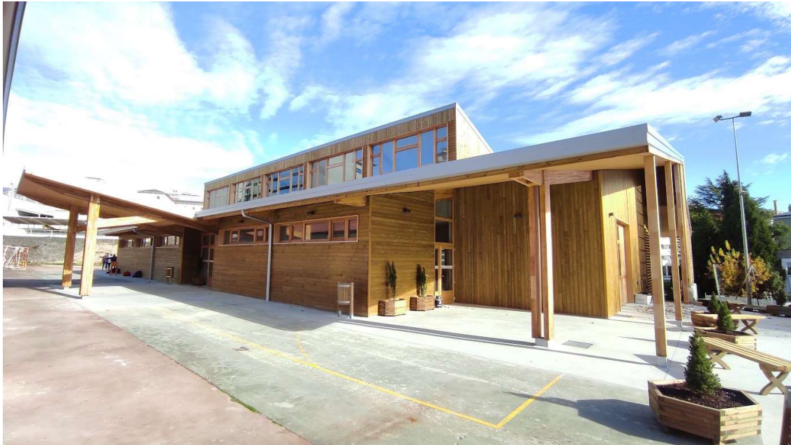
Ampliación del Centro Integrado de Formación Profesional Politécnico de Lugo con estructura de madera laminada de eucalipto en Lugo - Consejería de Cultura, Educación y Universidad de la Xunta de Galicia (2021) | Jesús Bouza Fernández, arquitecto